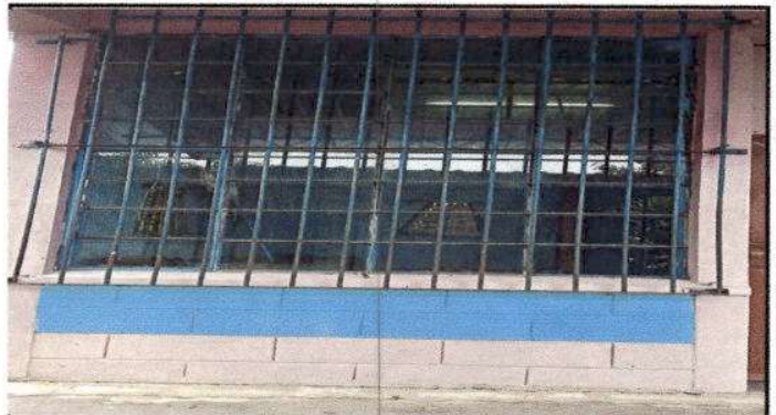
Foto 4: Mantenimiento a las estructuras de metal, que son balcones por deterioro.