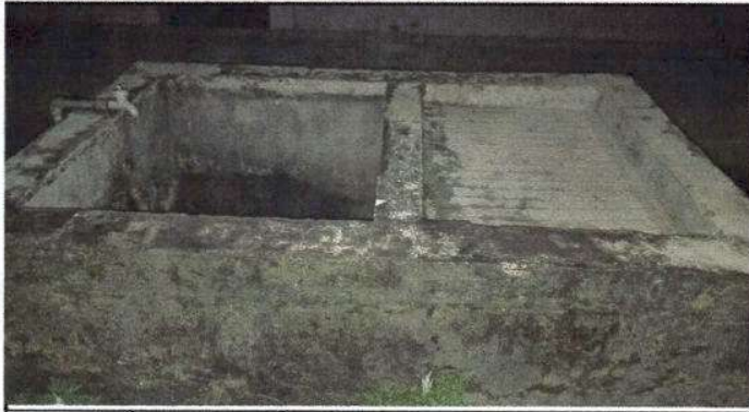
Foto 7: Susstitución de una pila de cemento por una pila de dos lavaderos.