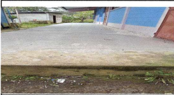
Foto 1: Sustrucción de piso de cemento por piso de granito (Corredores del establecimiento) 40 metros cuadrados.