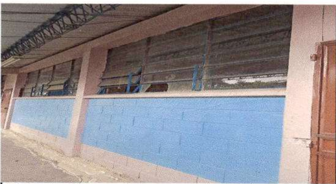
Foto 5: Instalación de nuevos balcones, para protección de las estructuras de metal.