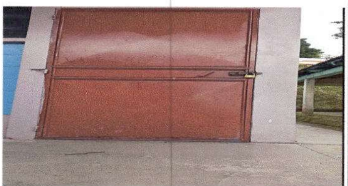
Foto 6: Mantenimiento a puertas, cortado, soldadura, lijado, pulida y pintura.

Observación: Si es necesario se pueden agregar hojas adicionales y actualizar el número de hojas.