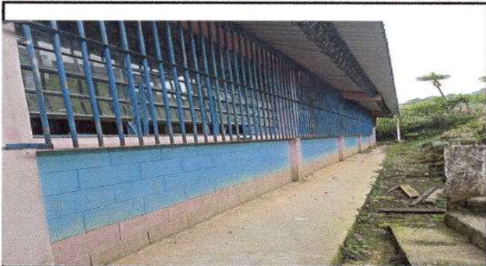
Foto 3: Aplicación de Pintura en Muros Exteriores e Interiores por deterioro.