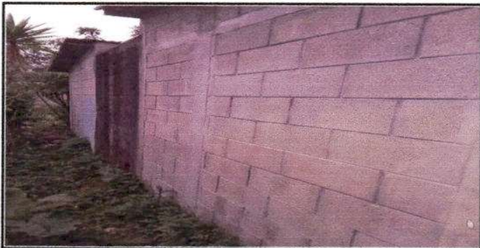
FOTO 9: Aplicación de Pintura las paredes de los Servicios Sanitarios.