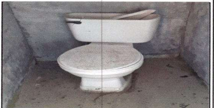
FOTO 10: Sustitución de inodoros por daños sufridos durante terremotos.