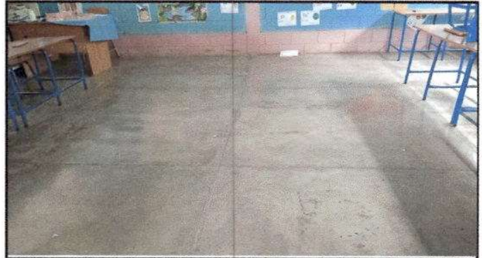
Foto 2: Sustrucción de piso de cemento por piso Cerámico de dos aulas, Dirección, Bodega Cocina.